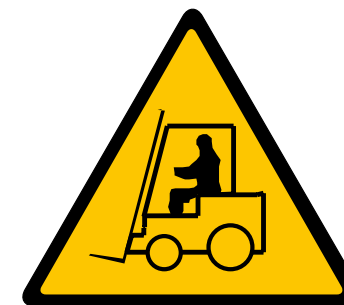
VEHÍCULOS DE MANUTENCIÓN