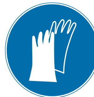
PROTECCIÓN OBLIGATORIA DE LAS MANOS