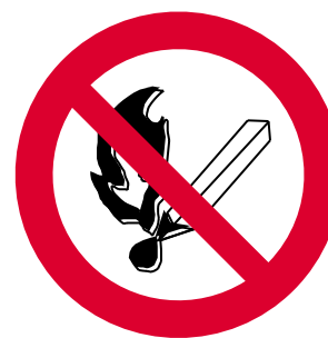
PROHIBIDO FUMAR Y ENCENDER FUEGO

“Con sindicatos el trabajo es más seguro”, y por ello, el desarrollo de la Estrategia Española de Seguridad y Salud en el Trabajo, en lo que se refiere a la actividad de los Agentes Sectoriales y Territoriales, como medio para que aquellos centros de trabajo que no tienen representación puedan asegurarse la implantación de la prevención de riesgos laborales, es imprescindible.