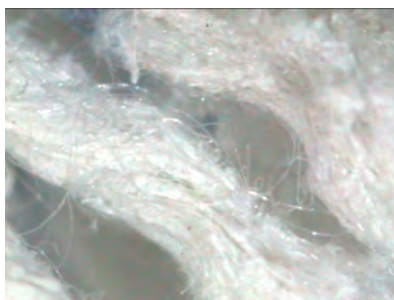
Fig 4: Presunto MCA (masa fibrosa con mezclas de distintos tipos de fibras)

Comentario: Posteriormente identificadas como fibras de algodón y fibras de amianto