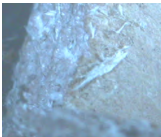
Fig 1: Presunto MCA (Fibras visibles en la superficie).

Comentario: Posteriormente identificadas como amianto crisotilo (MCA)