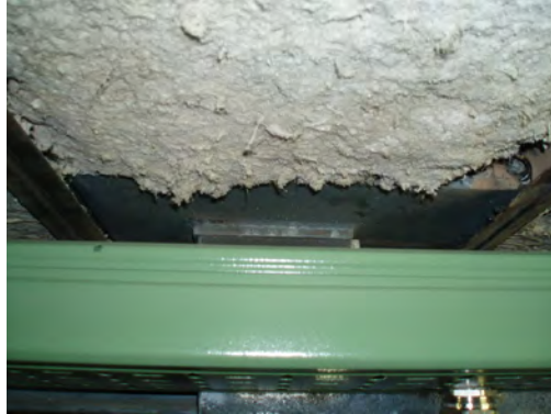
Figura 5: presunto MCA en un techo. El revestimiento presenta una textura típica de MCA. Incluso son perceptibles las fibras a simple vista

Comentario: Posteriormente identificadas como amianto crisotilo (MCA)