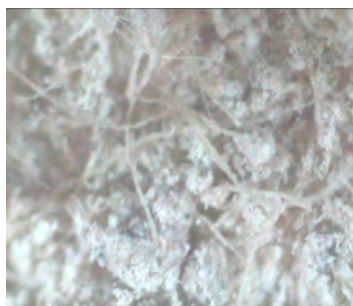
Fig 3: Presunto MCA (Fibras visibles en la superficie de un panel aislante. No se observa la formación en haces típica de las fibras de amianto)

Comentario: Posteriormente identificadas como fibras de celulosa (Material sin amianto)