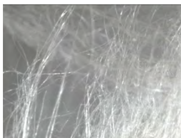
Fig 4: Presunto MCA (masa fibrosa)

Comentario: Posteriormente identificadas como lana mineral (Material sin amianto)